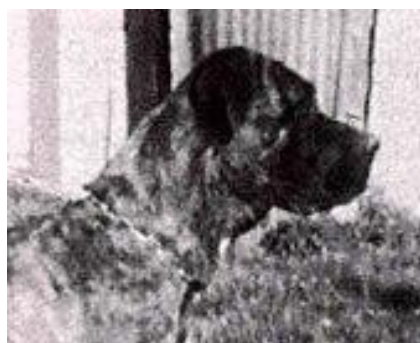
Dauno (ped: 005) és Brina (ped: 004)