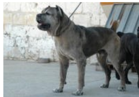
Diablo Casa Leone (tenyésztő: Umberto Leone)