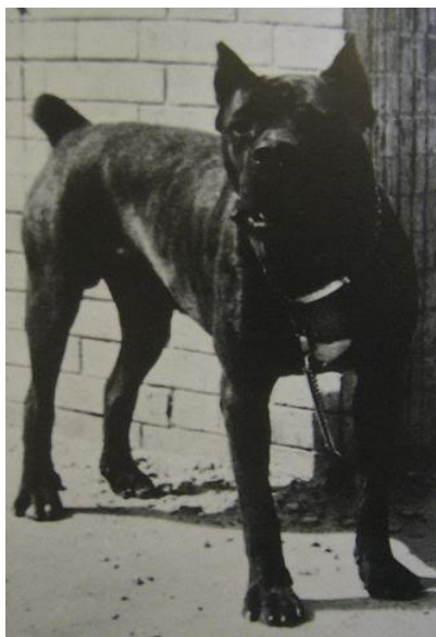
Corso Pugliából, 1950

Azonban ezt gyakran olyan értelemben használják, hogy „ódivatú, hosszú orrú” corso, egyértelműen egy gyengébb minőségre célozva ezzel.