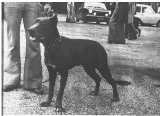
Mirak (ped: 001) és Aliot di Ortanova (ped: 002)